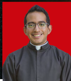
Por Daniel Francisco Tapia Lira