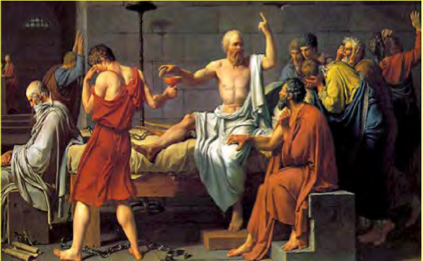
Pintura creada por el artista francés Jacques-Louis David, su nombre es Muerte de Sócrates (1787).

lo ponía cara a cara ante ellos: la Filosofía. No sorprende, que, al verse con demasiada frecuencia movido por los avances tecnológicos, por los inmensos medios de comunicación y de entretenimiento, haya dejado ya de ver atractiva su propuesta. Y, ¿en qué consiste tal? Nada menos que en que volvamos a pensar; y, sobre todo, que lo hagamos de la mejor forma posible, cosa que sólo lograremos en la medida que entendamos la realidad en su conjunto.